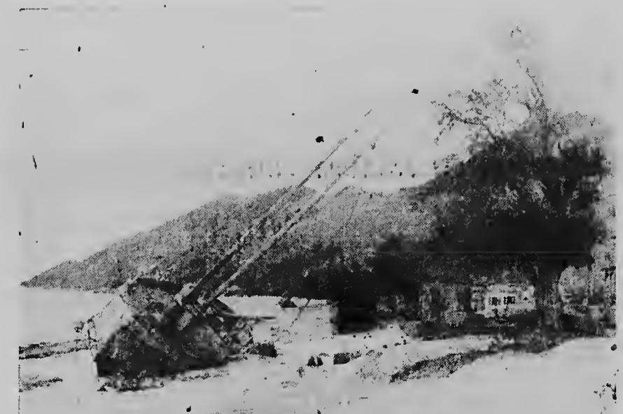
De „Return“ werd op de kust van het Franse gedeelte van St. Maarten geworpen en zwaar beschadigd. Herstel wordt niet mogelijk geacht.